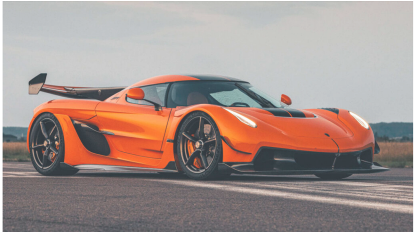
Für den Jesko von Koenigsegg sind wir als Serienlieferant für einige Baugruppen geführt

Du unterstützt uns im Bereich der Organisation und bekommst so Einblicke in alle Bereiche unseres Unternehmens. Vertrieb, Kundenbetreuung, Accounting - du wirst unsere Allzweckwaffe.